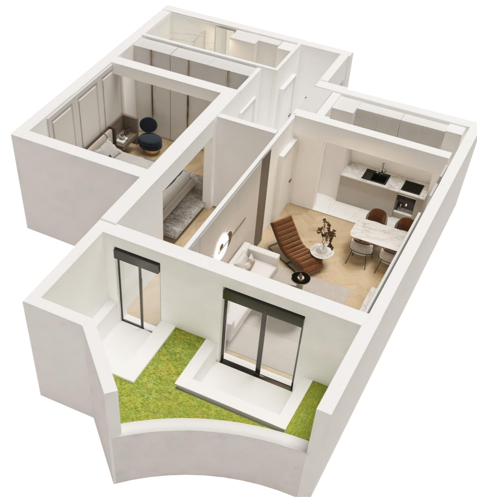
3D MODEL STANA

- OSNOVA TIPSKE ETAZE I-IX SPRATA. - Stanovi: 10, 25, 40, 55, 70, 85, 100, 115, 130.